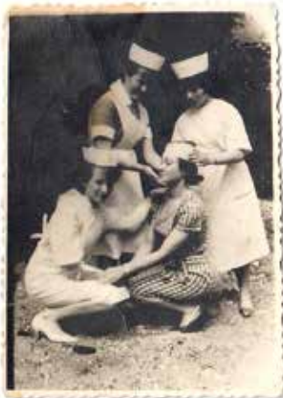
Rok 1962, praktyka na pierwszym roku szkoły pielęgniarskiej w Przemyślu ul. Buczka nad Sanem

Ależ oczywiście, żeby zostać dyplomowaną pielęgniarką musiałam najpierw ukończyć Zasadniczą Szkołę Medyczną Asystentek Pielęgniarskich Polskiego Czerwonego Krzyża oraz złożyć 13 lipca egzamin końcowy. I ... stanęło przede mną ogromne wyzwanie, gdzie pracować i kontynuować dalszą naukę.