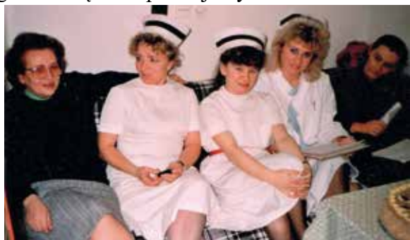
Rok 1991, pożegnanie koleżanki z Oddziału Laryngologii wyjeżdżającej do Niemiec

W czasie dyżurów uczyłyśmy się piec ciasta, szczególnie dobrze smakowały nam kruche.