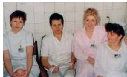
Gabinet opatrunkowy Wojewódzkiej Przychodni Onkologicznej