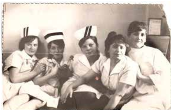
Rok 1964, zakończenie Szkoły Pielęgniarskiej

Decyzja nie powinna być trudna, przecież w Przemyślu praca by się znalazła.