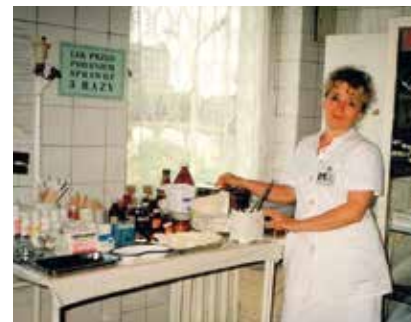
Gabinet opatrunkowy Wojewódzkiej Przychodni Onkologicznej

Pracując przez te lata, nie miałam problemu z pacjentami, wydaje mi się, że moje usposobienie i sposób podejścia do pacjenta jest na tyle spokojny i rzeczowy, że dawałam sobie radę z różnymi przypadkami. Wiem na czym polega ból i cierpienie, stąd w pierwszej kolejności moja pokora do tego co robię, rozumiem chorych i potrzebujących. Nie oczekuję zbyt dużo od życia. Biorę to co przynosi los, a bunt i tak nie zmienia sytuacji, co nie znaczy, że nie podejmuję walki o lepsze jutro.